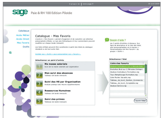
Accès direct par le responsable RH, Formation, DAF.