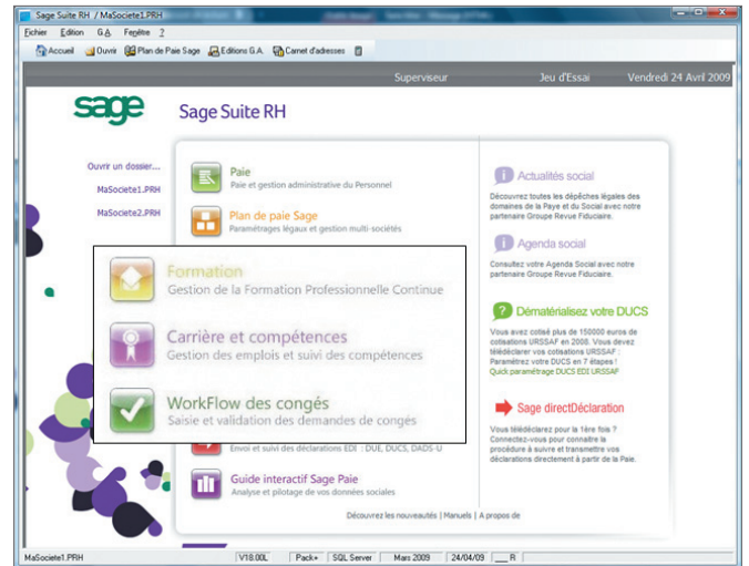
Accès facile aux fonctions RH